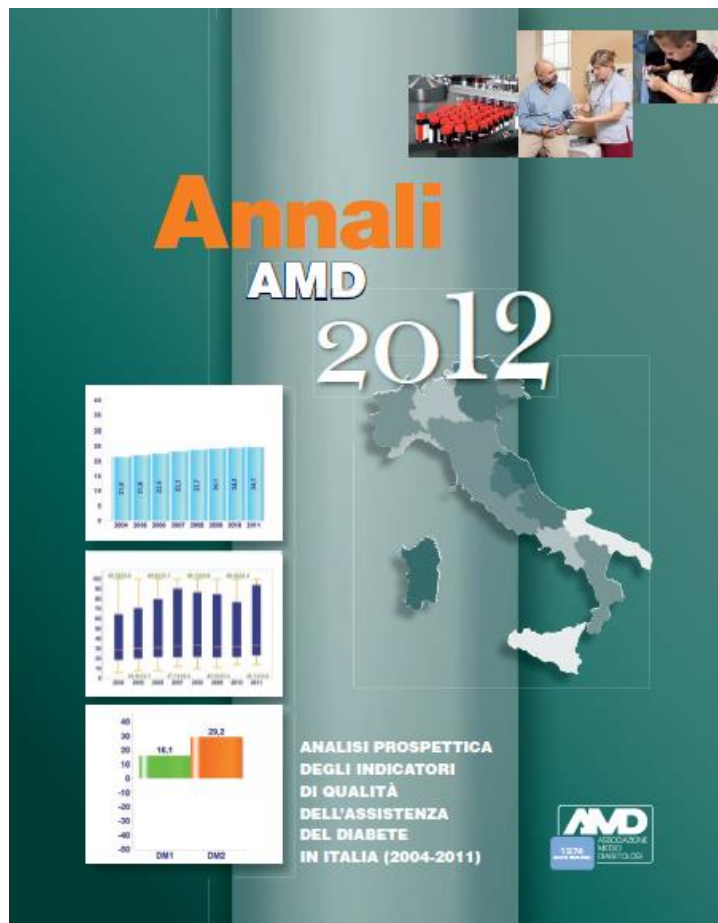
Numero di Centri e di pazienti inclusi nelle elaborazioni nei diversi anni confrontati